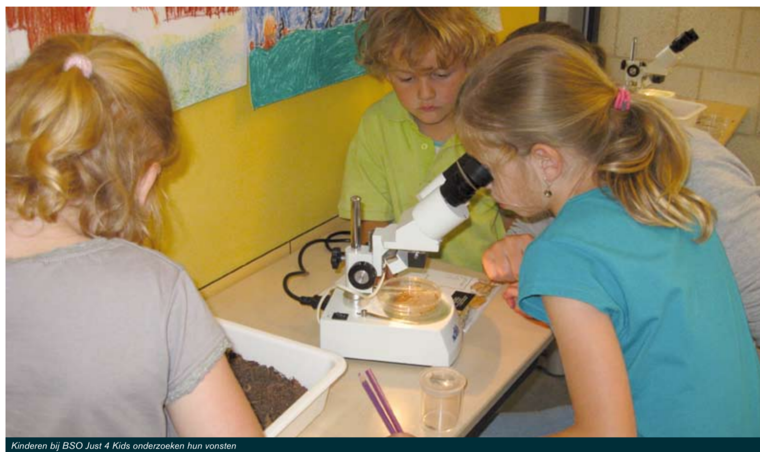
Kinderen bij BSO Just 4 Kids onderzoeken hun vonsten

Wil je meer weten over welke leskisten bij jou in de buurt te leen zijn? Neem dan contact op met één van de Natuur- en Milieu Centra. Voor adressen en telefoonnummers, zie de achterkant van deze krant.