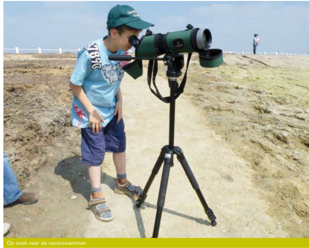
Op zoek naar de oeverzwaluwen

aangelegd, die aantrekkelijk is voor de oeverzwaluw; steil, stevig, kaal en aan het water, zodat ze insecten kunnen vangen. In totaal heeft de betonnen wand 200 genummerde gaten gevuld met zand. De oeverzwaluwen graven het gat uit tot een meter diep om nestjes in te bouwen."