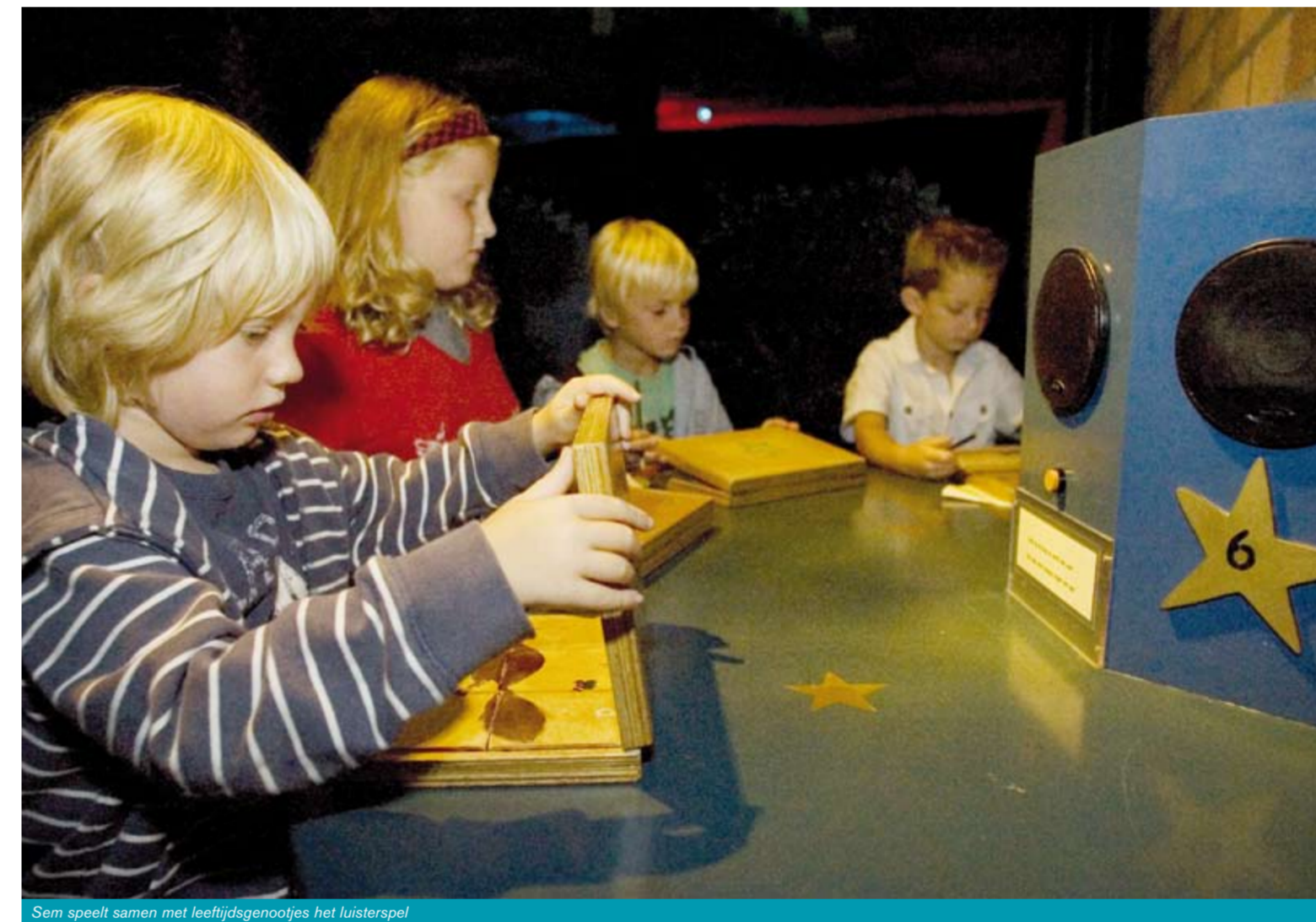
Sem speelt samen met leeftijdgenootjes het luisterspel

Zzzzz.....zzzz.....'s Nachts slapen we lekker. Als het donker en stil is. Maar als jij lekker in je bedje ligt, slapen dieren dan ook? Nee hoor, er is een heleboel gekruip, gesluip en gevlieg. Dieren zijn 's nachts niet zo stil als je denkt. Ontdek het zelf. Kom naar de nieuwe tentoonstelling 'Overnachten' in het Milieu Educatie Centrum (MEC).