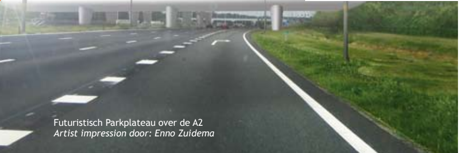
Futuristisch Parkplateau over de A2