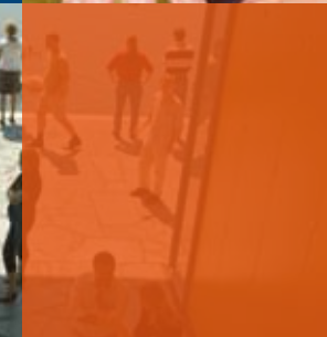
Open innovatie op de toekomstige High Tech Automotive Campus