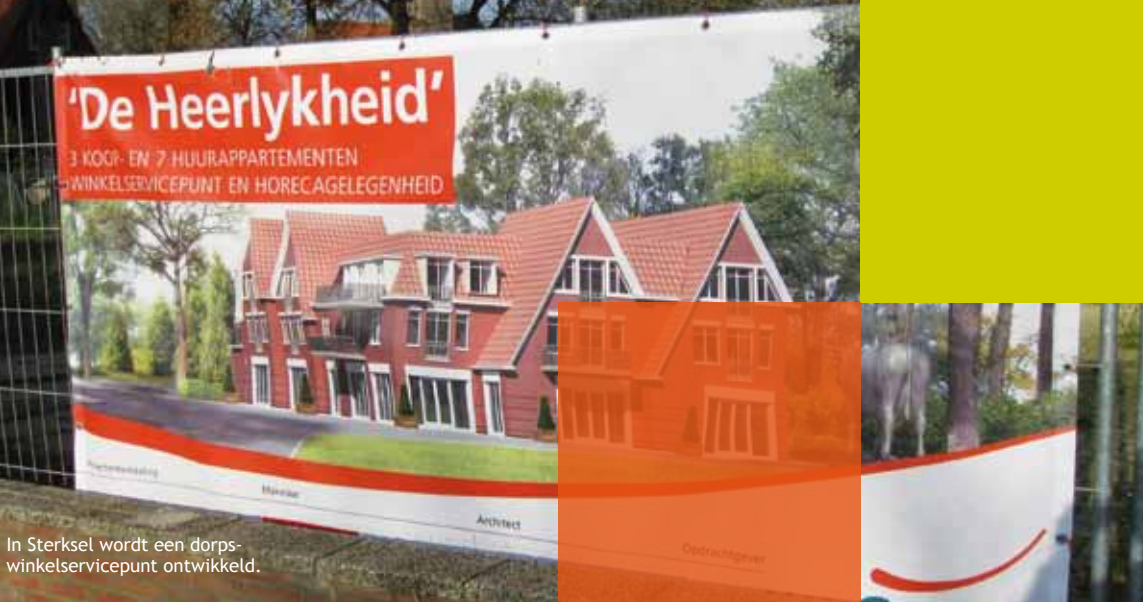
In Sterksel wordt een dorpswinkelservicepunt ontwikkeld.